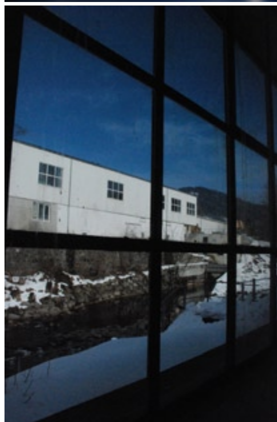
Fabrik-Impressionen: Ausblick von der Dachterrasse, die zukünftigen Wohnräume und die Sicht auf die Thur